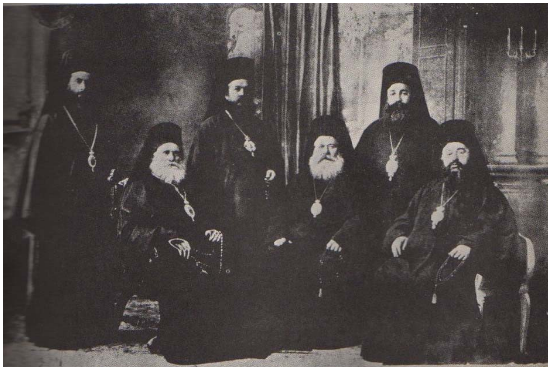
Г. Фотографија на бугарските достоинственици од Македонија избркани од нивните епархии во 1912 година од Србите